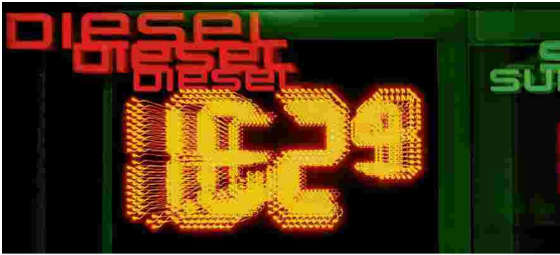
Autofahrer müssen sich auf Preissteigerungen beim Diesel einstellen.